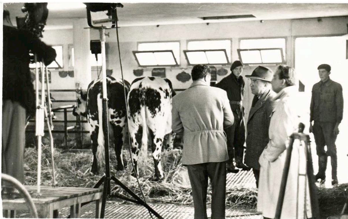
Séance de photos dans l'étable en 1953