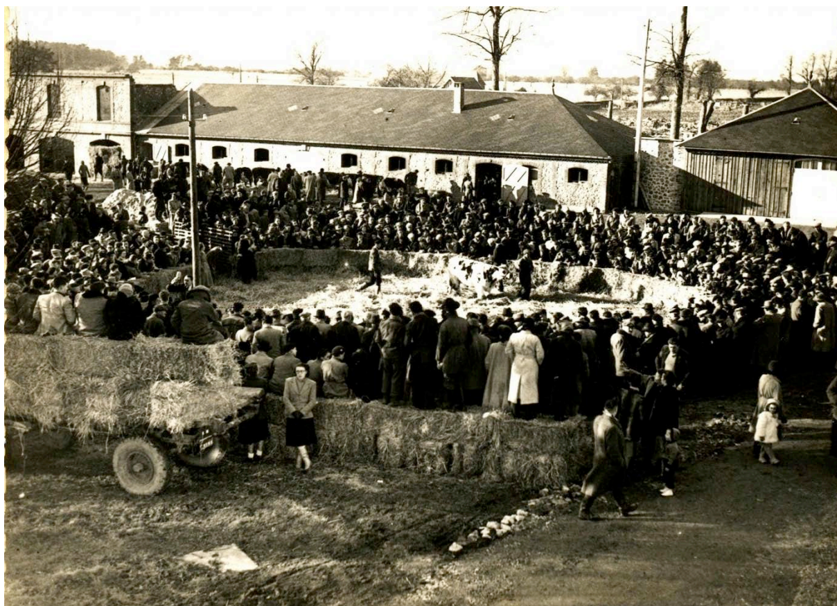
la « vente » de 1955