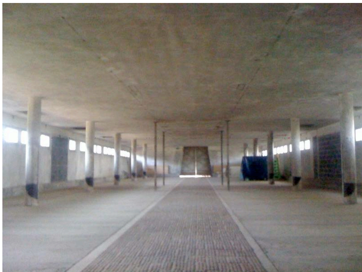
L'étable aujourd'hui / La salle d'exposition